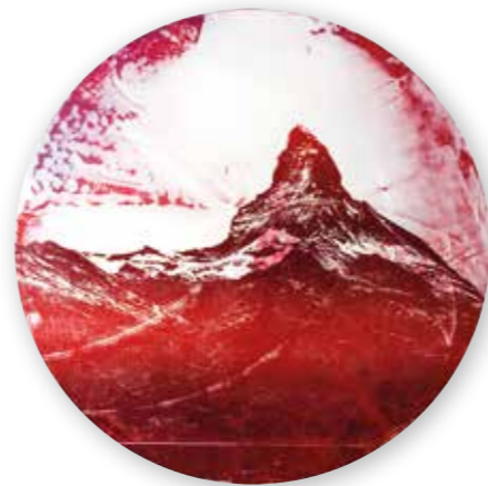
„Rote Scheibe II“, Mixed Media, Ø 66cm, 2016