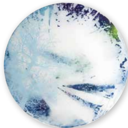
„Strukturen der Zeit III“, Mixed Media, Ø 66cm, 2016