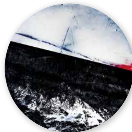
„Kosmische Scheibe 9“, Mixed Media, Ø 66cm, 2016