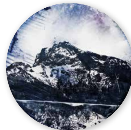
„Untersberg“, Mixed Media, Ø 66cm, 2016