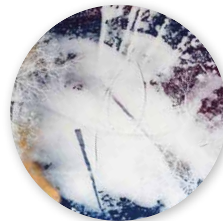
„Strukturen der Zeit VII“, Mixed Media, Ø 66cm, 2016