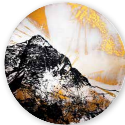
„Goldscheibe I“, Mixed Media, Ø 66cm, 2016